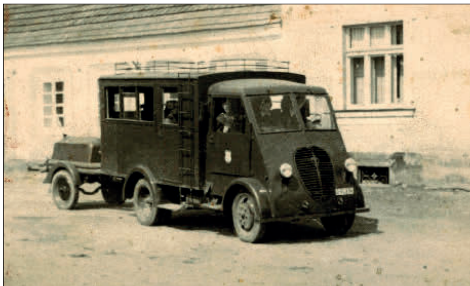
Vozidlo švihovských hasičů (1954)

V květnu 1945 našli jsme ve škarpe ležeti opuštěný zánovný nákladní vůz francouzské výrobní značky. Vůz byl poškozený a ujel něco přes 1 000 km. Na naši žádost, darovala nám jej americká armáda. Vůz jsme si opravili a předělali na nářadový vůz. Po provedení oprav předepsala nám finanční správa clo ve výši 58 000,- Kčs přes to, že jsme vůz dostali darem pro hasičský sbor.