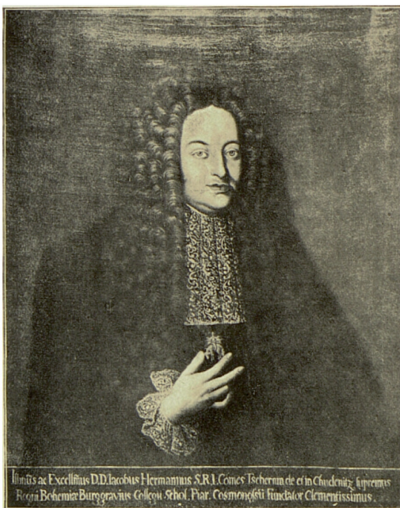
Heřman Jakub Černín (1659 – 1710) – nejvyšší purkrabí Českého království