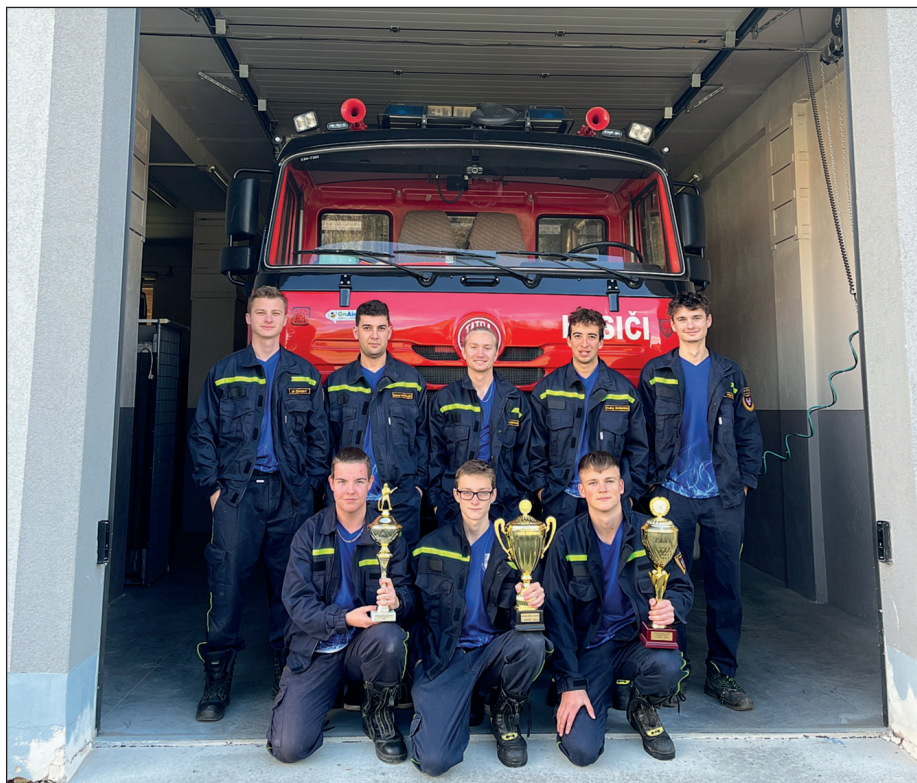
Soutěžní družstvo mužů

Sbor dobrovolných hasičů ve Švihově byl založen v roce 1879. V současné době má 129 členů. Sbor si za vedení 7 vedoucích mládeže vychovává své nástupce, kterých je 56. Přípravka ve věku 3-6 let má 6 dětí, mládež ve věku 7-15 let čítá 46 dětí a nakonec ještě 4 dorostence ve věku do 18 let. Přípravce se věnujeme 1 hodinu týdně a mládeži 2 hodiny týdně. Letos se děti zúčastnily šesti soutěží a vždy se umísťovaly na předních místech. Předposlední soutěží byl okresní závod branné všestrannosti, kde se družstvo mladších umístilo na prvním a čtrnáctém místě z 36 družstev, starší pak dosáhli na čtvrtou a pátou příčku ze 40 družstev. Soutěže se zúčastnili také dva dorostenci a jedna dorostenka, ti se všichni probjovali do krajského kola, ať už v jednotlivcích, tak s družstvem v kterém pomáhali, stejně jako družstvo mladších, kteří také postoupili do kraje. Tam naše radost vygradovala, jelikož družstvo mladších se umístilo na krásném druhém místě a v dorostenkách jsme si sáhli pro umístění nejvyšší. Družstvo postupuje do republikového kola konaného v březnu v Benešově, dorostenci bohužel krajským kolem v jednotlivcích končí. Stejně tak se umístil další náš dorostenec, hostující za jiným týmem, na druhém místě a společně postupují jako družstvo také na republiku. Je vidět,